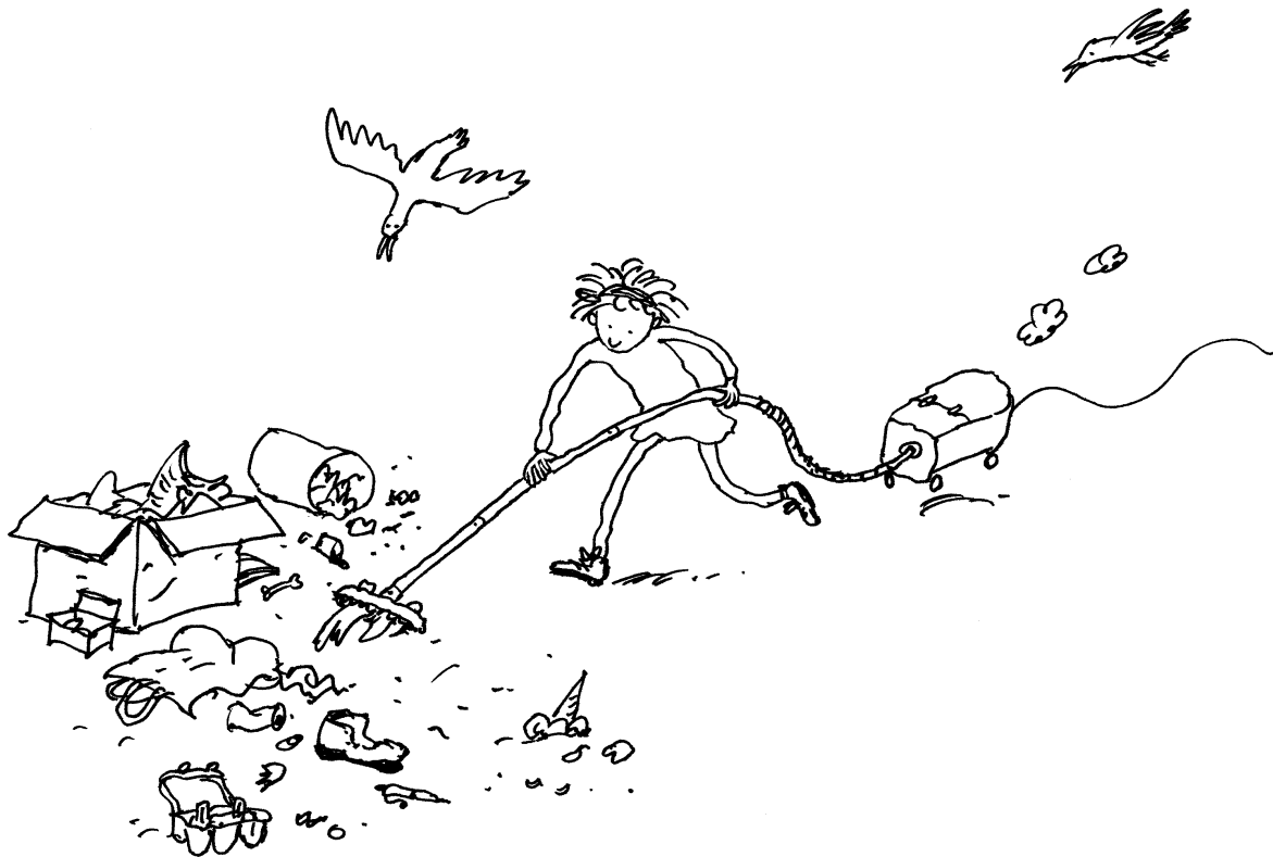
Illustratie Zwerfafval: mooi niet!