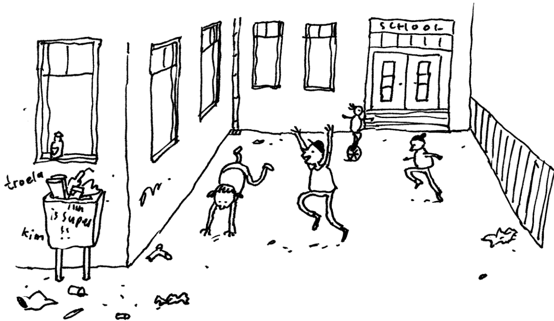
Schoolplein met zwerfafval (uit Zwerfafval: mooi niet! )

Meestal moet je het onderwerp nog bedenken. Nu weet je het al. Je gaat een spreekbeurt houden of een werkstuk maken over zwerfafval . Dat is een heel goed onderwerp! Zwerfafval is namelijk een belangrijk probleem in ons land. Je ziet het overal om je heen. Het is afval dat grote mensen of kinderen hebben weggegooid op een plek waar het niet hoort. Bijvoorbeeld op straat, in een bos of park, langs de kant van de weg of op de speelplaats. Het is goed om te schrijven of te vertellen over zwerfafval. Daarmee breng je dit onderwerp onder de aandacht. Hoe meer mensen inzien dat zwerfafval slecht is, hoe minder zwerfafval er komt.